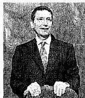
Presidente Ignazio Marino